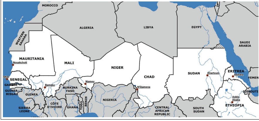
Resim 1: Mali ve Sahel Bölgesi.